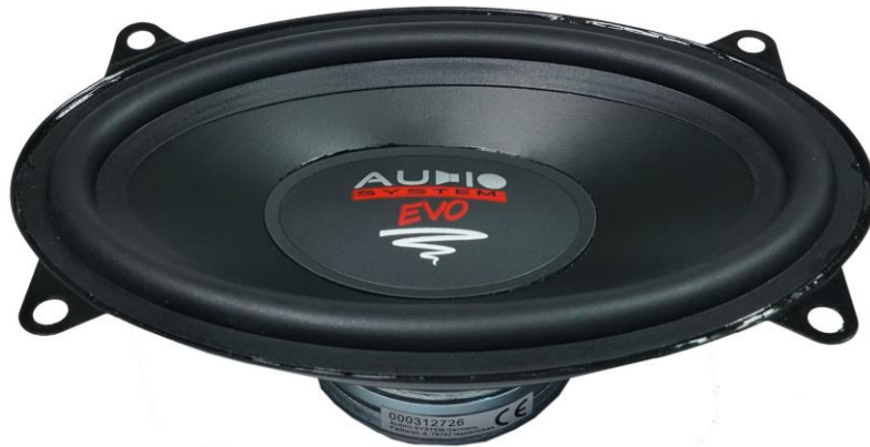
EX 406 SQ EVO3